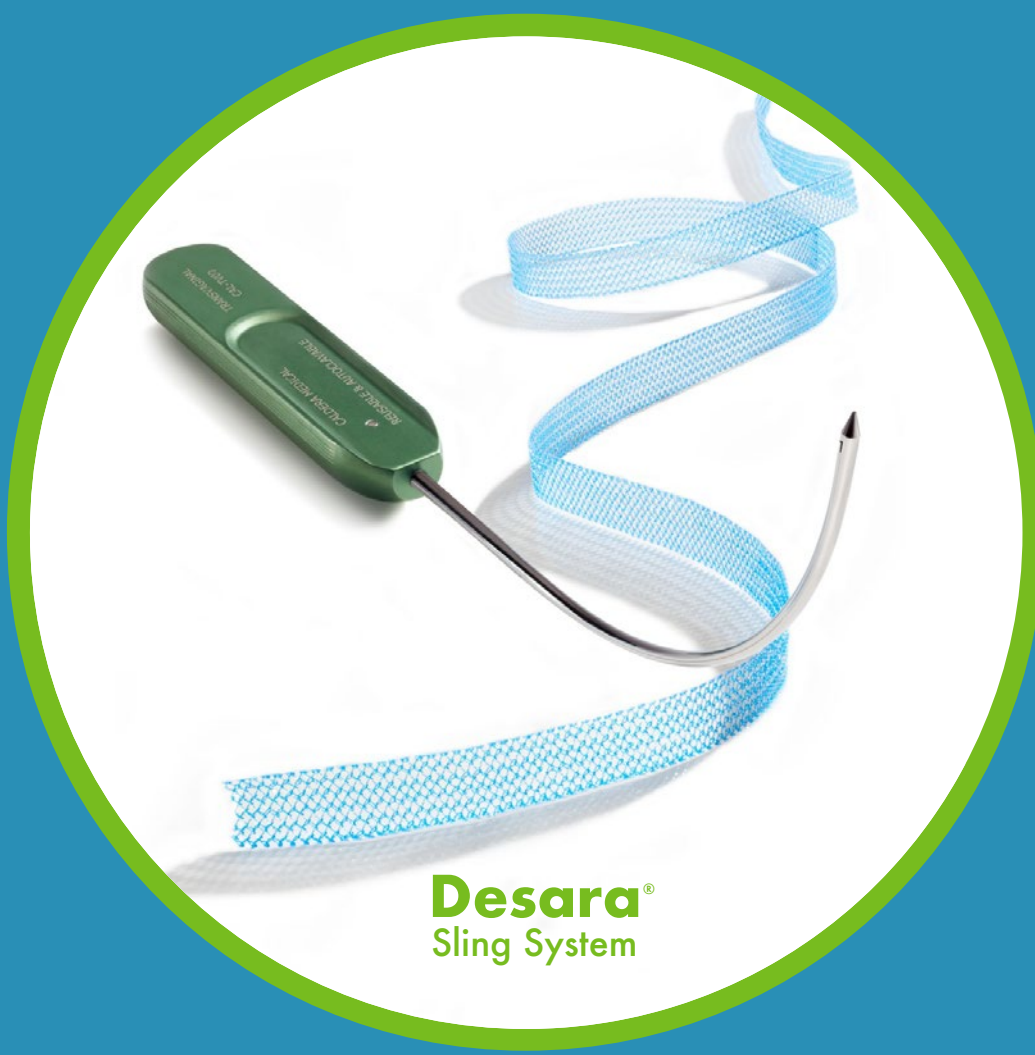
Desara® Sling System